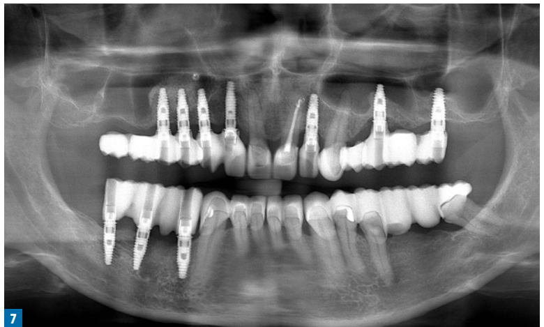
Fot. 7. Zdjęcie ortopantomograficzne wykonane z założoną podbudową PMMA zawierającą kontrast RTG

po 7 dniach, a następnie co 6 miesięcy od oddania w użytkowanie pracy ostatecznej.