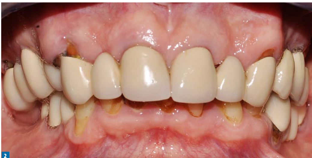
Fot. 2. Stan wyjściowy przed leczeniem (widoczne nieszczelne korony, recesje dziąsłowe, zaburzona pozioma płaszczyzna zgryzu wraz z powiększonym nagryzem poziomym oraz ze zgryzem głębokim)