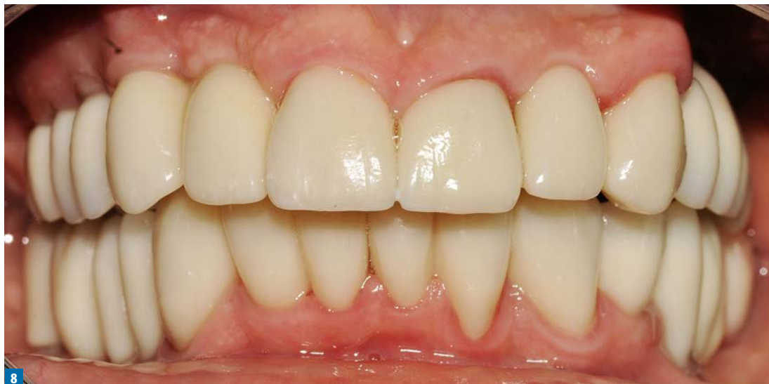
Fot. 8. Mosty i korony na podbudowie z tlenku cyrkonu