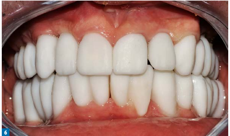
Fot. 6. Podbudowa wykonana z materiału PMMA zawierającego kontrast RTG w celu sprawdzenia szczelności przylegania

Sprawdzono zgryz, artykulację i fonetykę, praca całkowicie spełniała oczekiwania estetyczne pacjenta. Wyznaczono termin kontroli na następną dzień,