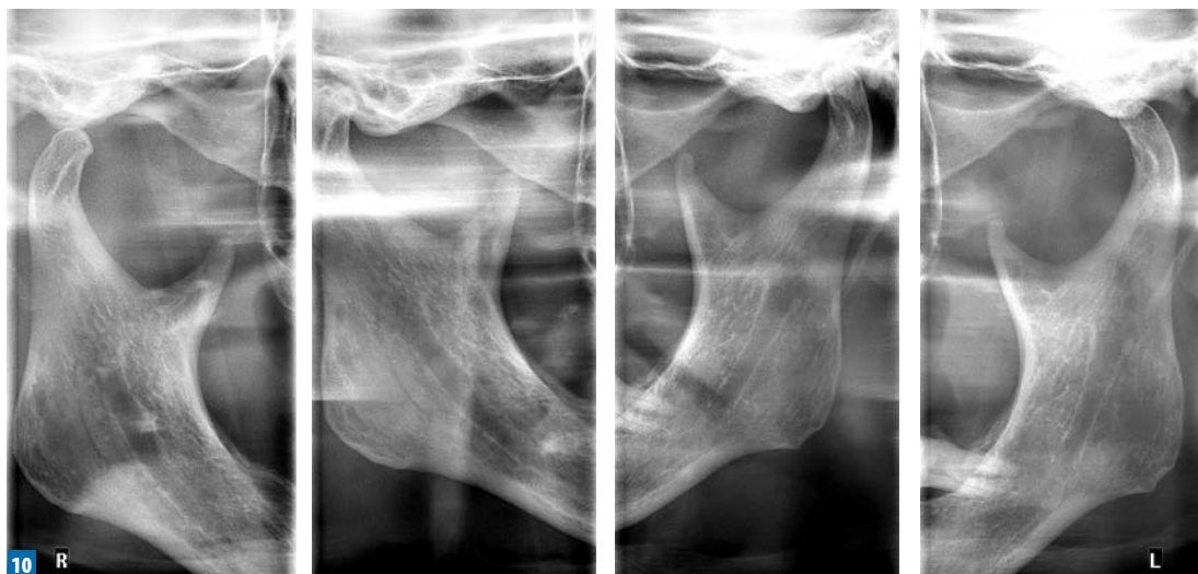
Fot. 10. Zdjęcie stawów skroniowo-żuchwowych w zwarcie i rozwarciu wykonane po przeprowadzonym leczeniu implantoprotetycznym