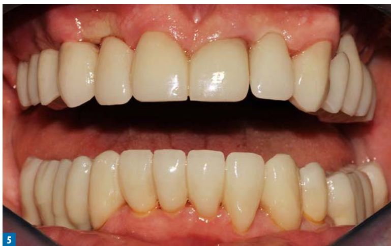
Fot. 5. Mosty tymczasowe na implantach i zębach własnych wykonane technologią CAD/CAM z materiału PMMA