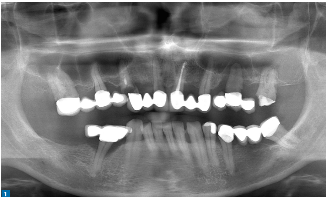
Fot. 1. Zdjęcie ortopantomograficzne wykonane przed leczeniem