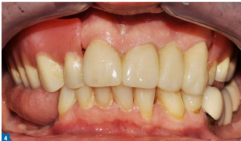
Fot. 4. Uzupełnienia tymczasowe – proteza częściowa osiadająca górna oraz most tymczasowy PMMA na zębach: 11, 21, 23