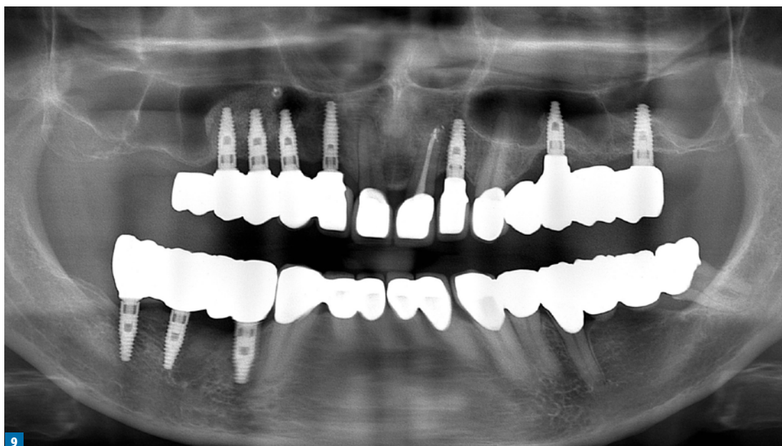
Fot. 9. Zdjęcie ortopantomograficzne wykonane po osadzeniu i przykręceniu mostów oraz koron