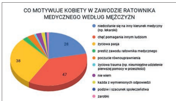
Ryc. 2. Motywacja w zawodzie ratownika w oczach mężczyzn