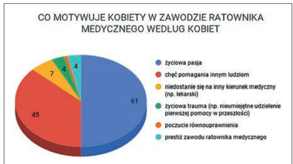
Ryc. 6. Motywacja w zawodzie ratownika w oczach kobiet