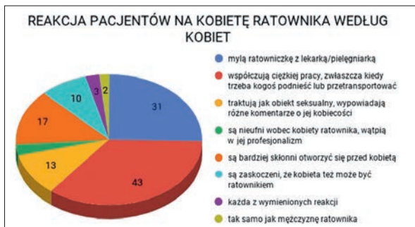
Ryc. 4. Reakcja pacjentów na kobietę ratownika według kobiet

► kim chęcią pomagania innym ludziom i życiową pasją (ryc. 2).