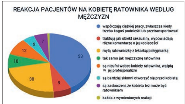
Ryc. 5. Reakcja pacjentów na kobietę ratownika według mężczyzn